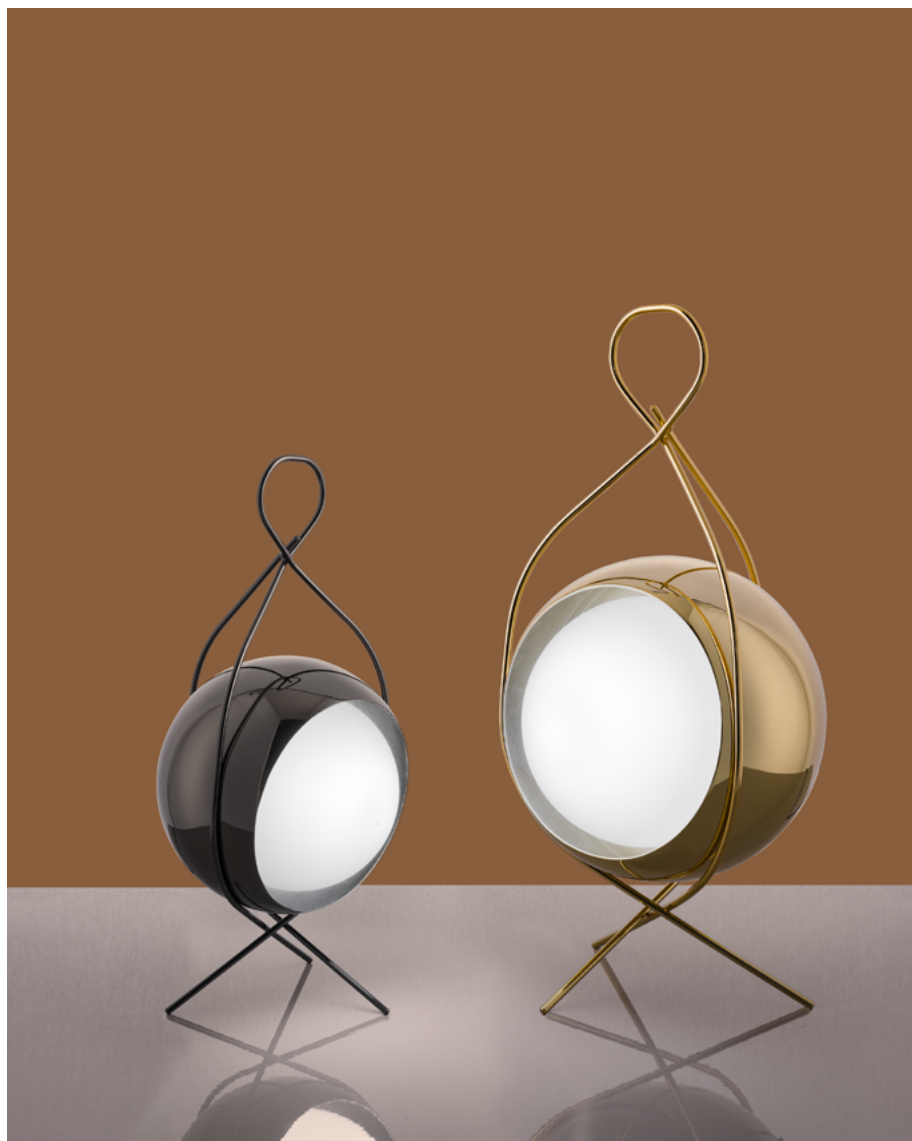
Nobody lamp small | big